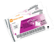
Up chèque culture