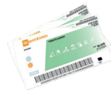
Up sport & loisirs